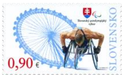
520) športovec na vozíčku, koleso londýnskeho lunaparku, logo