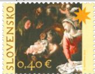
527) Hans von Aachen (1552-1615): Narodenie Krista