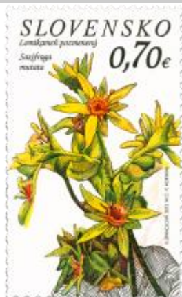
524 a kupón C) Lomikameň pozmenený ( Saxifraga mutata )

2012, 12. 10. * Národný park Nízke Tatry (Ochrana prírody) * príležitostné známky v hárčekovej úprave * N: K. Štanclová, RR: M. Činovský, R: F. Horniak * OTp+OF PTC * H: 2 ZP + 3 K, TF: 1 H * papier FLA * RZ 11 3/4 * FDC N: K. Štanclová, R: R. Cigánik, OTp TAB * náklady: po 50 tis. (50 tis. H)