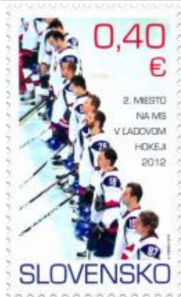
516) hokejisti po skončení zápasu

2012, 25. 5. * 2. miesto na MS v ľadovom hokeji 2012 * príležitostná známka * N: A. Ferda * OF PTC * PL: 50 ZP, TF: 4 PL * papier FLA * KHZ 11 ¼ : 11 ¾ * FDC OF PTC * náklad: 250 tis.