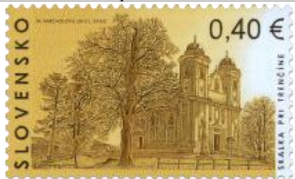
521) Pútnické miesto Skalka pri Trenčíne

2012, 13. 7. * Skalka pri Trenčíne (Krásy našej vlasti) * príležitostná známka * N: M. Žálec Varcholová, R: Ľ. Žálec * OTr+HT PTC * PL: 50 ZP, TF: 2 PL * papier FLA * RZ 11 ½ : 11 ¼ * FDC N: M. Žálec Varcholová, R: Ľ. Žálec, OTp TAB * náklad: 1 mil.