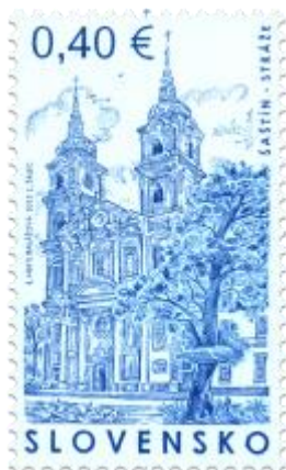
522) Bazilika Sedembolestnej Panny Márie v Šaštíne