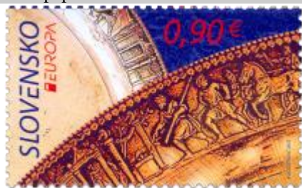
515, kupón) rímsky tanier Lanx Diskos nájdený v Krakovanoch

2012, 4. 5. * Návšteva (Europa) * príležitostná známka * N: P. Augustovič * OF PTC * PL: 8 ZP + 4 K, TF: 4 PL * papier FLA * KHZ 11 ¾ : 11 ¼ * FDC N: P. Augustovič, OF PTC * náklad: 200 tis. (25 tis. PL)