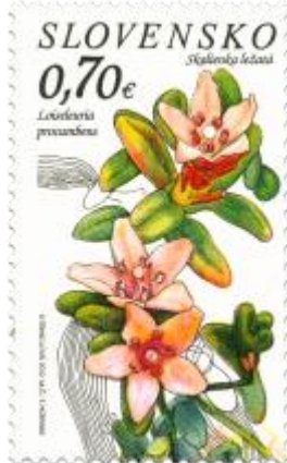
525 a kupón B) Skalienka ležatá ( Loiseleuria procumbens )

kupón A) Babôčka pávooká ( Inachis io ), Babôčka admirálska ( Vanessa atalanta )