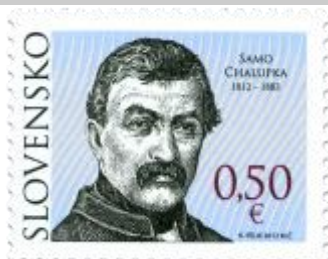
512) Samo Chalupka (1812 – 1883) – slovenský básnik

2012, 27. 2. * Samo Chalupka (Osobnosti) * príležitostná známka * N: K. Felix, RR: M. Činovský * OF PTC * PL: 50 ZP, TF: 4 PL * papier FLA * KHZ 11 ½: 11 ¼ * FDC N: K. Felix, R: L. Žálec, OTr PTC * náklad: 300 tis.