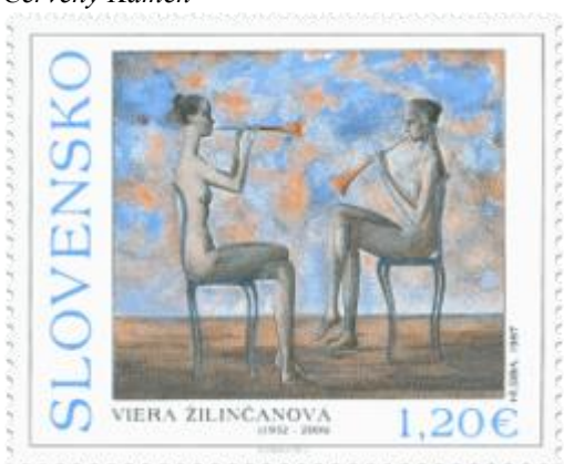
529) Viera Žilinčanová (1932 – 2008): Hudba

K) Viera Žilinčanová: Spomienka na Krétu