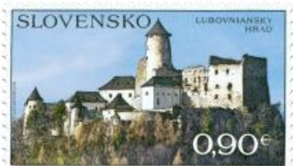
526) Lubovniansky hrad