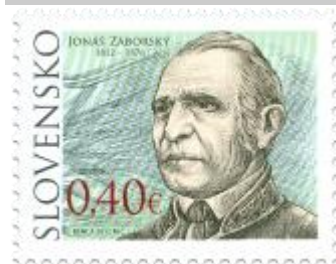
511) Jonáš Záborský (1812 – 1876) – slovenský spisovateľ a historik

2012, 3. 2. * Jonáš Záborský (Osobnosti) * príležitostná známka * N: I. Benca, RR: M. Činovský * OF PTC * PL: 50 ZP, TF: 4 PL * papier FLA * KHZ 11 ½: 11 ¼ * FDC N: I. Benca, R: Ľ. Žálec, OTp PTC * náklad: 300 tis.