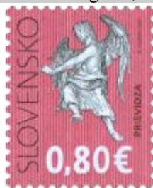
510) Socha anjela

2012, 27. 1. * Kultúrne dedičstvo Slovenska: Piaristický kostol v Prievidzi * výplatná známka * N+R: R. Cigánik, GÜ: P. Augustovič * OTr+HT PTC * PL: 100 ZP, TF: 2 PL * papier FLA * RZ 11 ¼ : 11 ¼ * FDC N+R: R. Cigánik, OTp PTC * náklad: 2 mil.