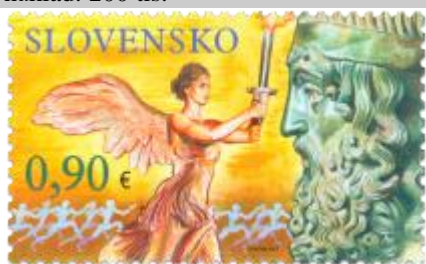
519) symbolická kresba antických OH

2012, 28. 6. * Olympijské hry Londýn 2012 * príležitostná známka * N: I. Piačka * OF PTC * PL: 50 ZP (25+25 ZP v šachovnicovej sútláči so známkou č. 520), TF: 4 PL * papier FLA * KHZ 11 ¾ : 11 ¼ * FDC * náklad: 200 tis.