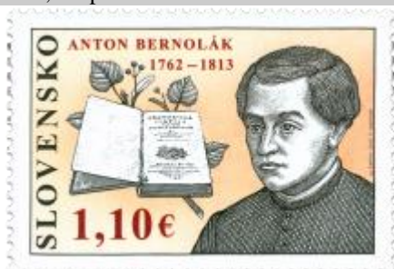
523) Anton Bernolák (1762 – 1813) – slovenský jazykovedec a kňaz