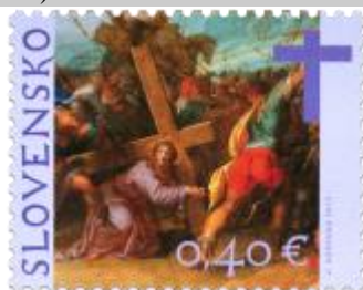
513) Hans von Aachen (1552-1615): Nesenie kríža